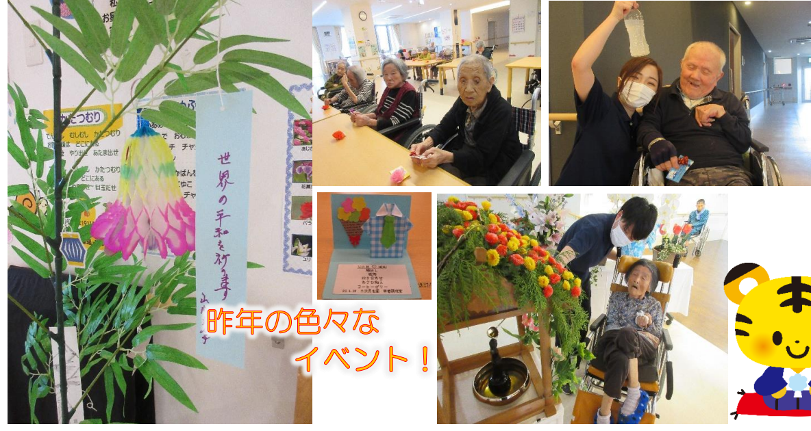
昨年の色々なイベント!

明けましておめでとうございます。昨年入所者の皆様と色々な思い出をつくることができました。今年もよろしくお願い致します。