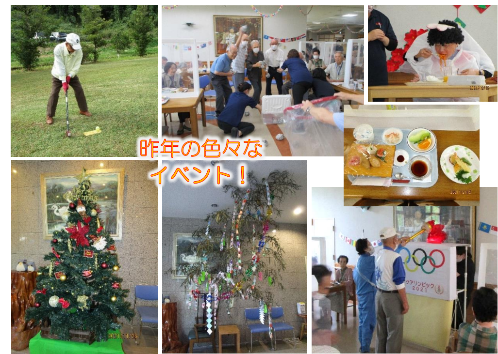
昨年の色々なイベント!

新年あけましておめでとうございます。昨年は、新型コロナウイルス感染症のため、ご面会や行事など 試行錯誤しながらのサービスをしてみましたが、ご理解、ご協力をいただき誠にありがとうございました。 今年も引き続き、感染予防を徹底しながら、私たちが今できることを常に考え、一層のサービス向上に努めてまいりますので、よろしくお申し込み申し上げます。