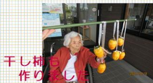
干し柿の作りかた

明けましておめでとございます。新型コロナウイルスの影響にて昨年も様々な制約の中での生活ではありましたが、傾聴ボランティアの方とリモートで会話を楽しんでいたり、屋外での行事を増やし、銀杏の皮剥き作業や干し柿づくり、芋ほり等を行っていただきました。今年も様々な工夫を行いながら充実した日々を送って頂けるように頑張りますので、ご協力よろしくお願致します。