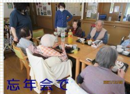
忘年会で1年の締めくくり