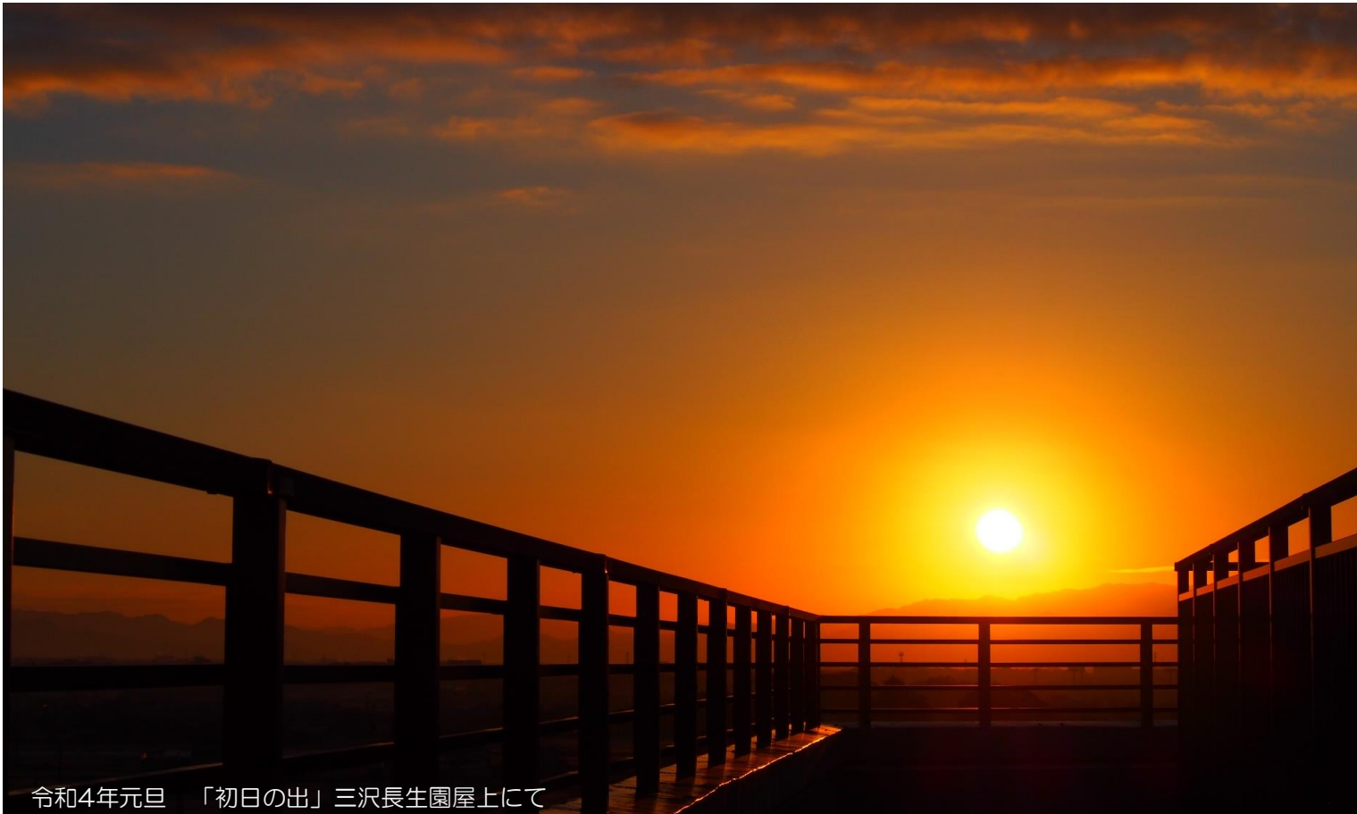
令和4年元旦 「初日の出」三沢長生園屋上にて

第38号 (新春号) 発行日 令和4年 1月1日 発行元 社会福祉法人 長生会 〒838-0106 小郡市三沢字花簗(ハナツゲ)881-1 TEL(0942)75-4113 FAX(0942)75-4115 担当 法人本部事務局 経営企画室 ※昭和52年から発行していた石楠花を平成版として再発行を開始してからの通し号数。