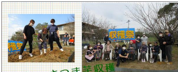
収穫祭～さつまいも収穫