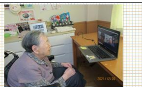
傾聴ボランティアの方とパソコンで会話