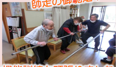
機能訓練も頑張りました！