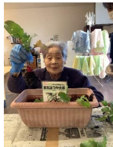
昨年の思い出の写真！