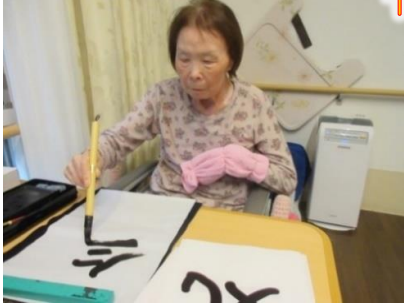
令和5年1月～4月の思い出の写真！