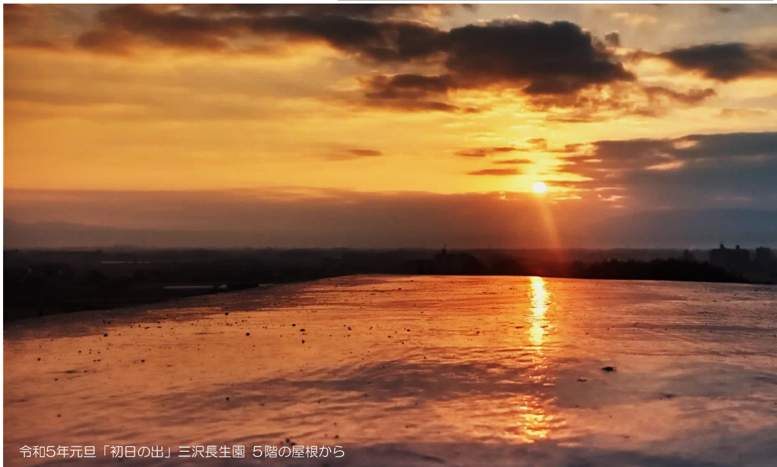
令和5年元旦「初日の出」三沢長生園 5階の屋根から

発行日 令和5年 1月5日 発行元 社会福祉法人 長生会 〒838-0106 小郡市三沢字花簞(ハナツゲ)881-1 TEL(0942)75-4113 FAX(0942)75-4115 担当 法人本部事務局 経営企画室 ※昭和52年から発行していた石楠花を平成版として再発行を開始してからの通し号数。