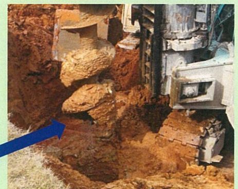
コンクリートミルクが放出される杭機の先端部分

プラントで配合されたコンクリートミルクがパイプを通り、杭機の先端より穴の中で放出されます。