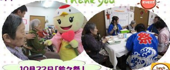
10月22日「鈴々祭」を開催しました！

台風の為室内で行いましたが、皆様ゲームやしりとりなど楽しんでいただきました(#^.^#)