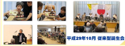
平成29年10月 従来型誕生会