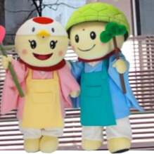
写真:三沢長生園 前

平成29年11月10日(金)をもちまして、投票が終了致しました！ ご協力頂きました皆様、応援ありがとうございました。 結果は11月19日(日)に公式ホームページにて発表されます。