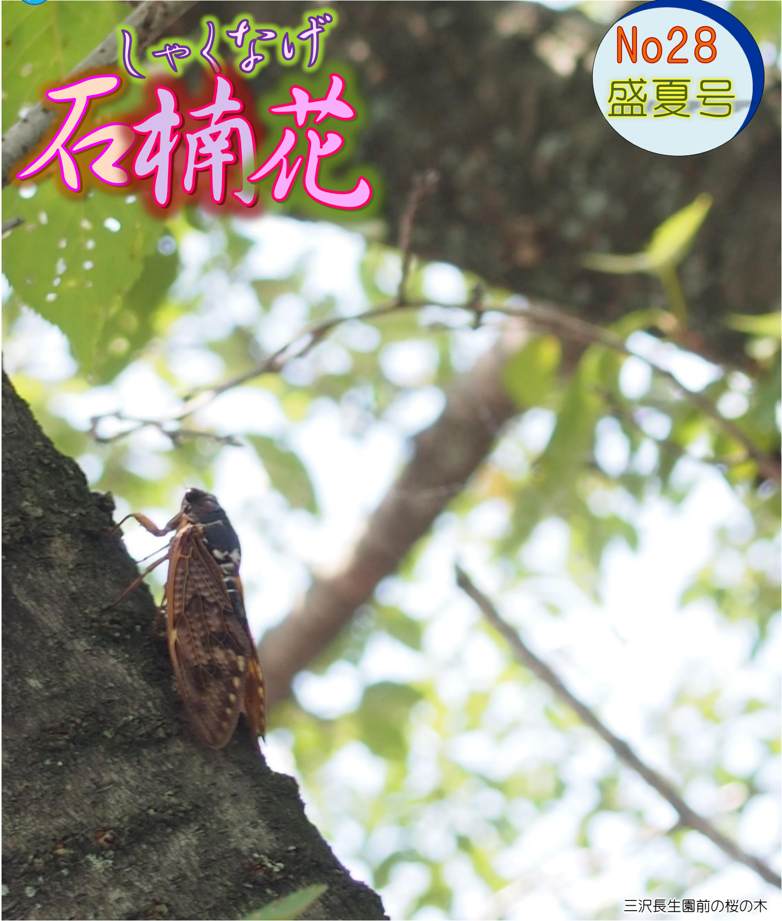
三沢長生園前の桜の木