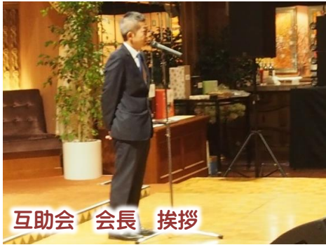
互助会 会長 挨拶