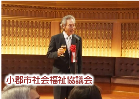
小郡市社会福祉協議会