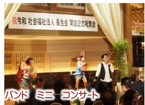
祝令和 社会福祉法人 長生会 開設記念祝賀会 バンド ミニコンサート