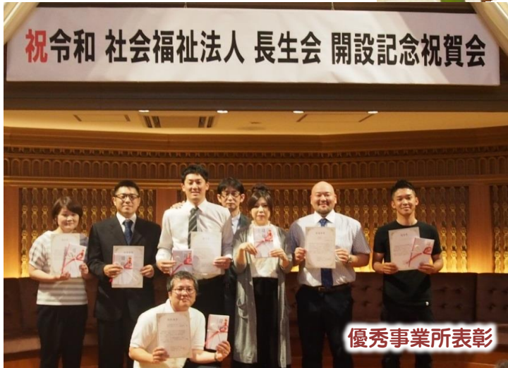
祝令和 社会福祉法人 長生会 開設記念祝賀会