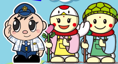
福岡県警 ふっけい君