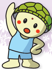
かめぞう 亀蔵くん